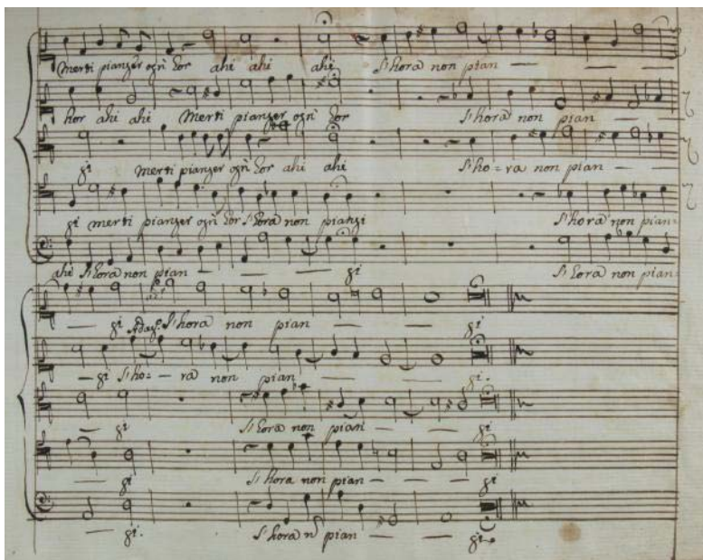
IMAGEN 2: Madrigal Gran Dio, ah, voi languite de Pistocchi, parte final (autógrafo) Bologna, Academia Filarmónica, Archivio e Biblioteca , capsula II, n. 31, inventario no. N.I.G. 17695, c. 6r

Las competencias de Pistocchi, como cantante y compositor, han sido evidenciadas también por el violinista y compositor Giuseppe Torelli (1658-1709) que, en la misma carta del 10 de febrero de 1700, agrega al margen una anotación para Perti: