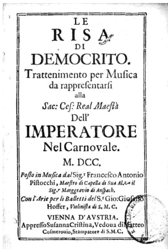
IMAGEN 1: Portada del libretto Le risa di Democrito Milán, "Biblioteca Nazionale Braidense", Racc. Dramm. Corniani Algarotti 3644

«[...] Oggi faremo la prima prova in Teatro, coll'intervento dell'Imperatore[,] cosa strana mentre sento che lasci fare sempre due e tre prove almeno[,] avanti di andarvi, ma a questa mia o[pera] bisogna che n'abbi curiosità, sarà ciò ch'a Dio piace [...]» (I-Bc, K.044.2.181).